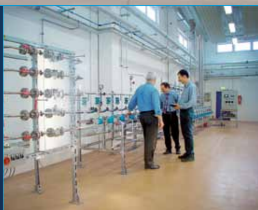
BANC D'ESSAI (TLV Europe)