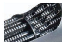
スパイラルチューブ

汚れが付着しにくいスパイラルチューブの伝熱管により、小型の給湯器に見られる熱交換器の詰りトラブルを抑制します。