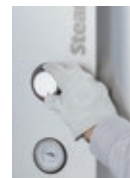
温度はダイヤル調整