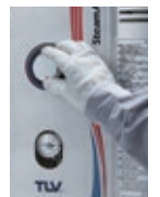
温度はダイヤル調整