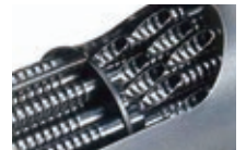
スパイラルチューブ

汚れが付着しにくいスパイラル チューブの伝熱管により、小型 の給湯器に見られる熱交換器の 詰りトラブルを抑制します。