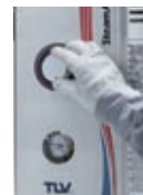
温度はダイヤル調整