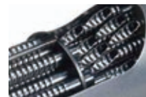
スパイラルチューブ

汚れが付着しにくいスパイラル チューブの伝熱管により、小型 の給湯器に見られる熱交換器の 詰りトラブルを抑制します。